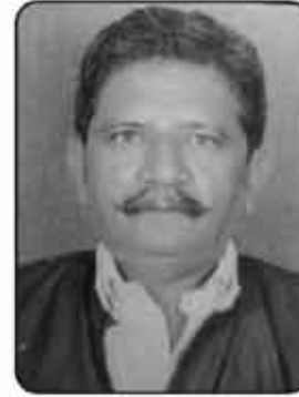
ગઢવી ખેતાભા કરમણભા ગ્રામ પંચાયત સદસ્ય લાકડીયા