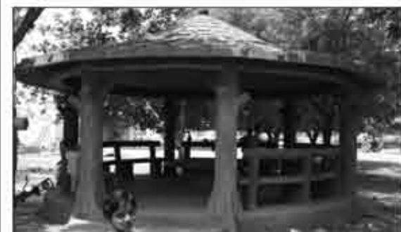
ગોકુળ દર્શન (મટુલી)