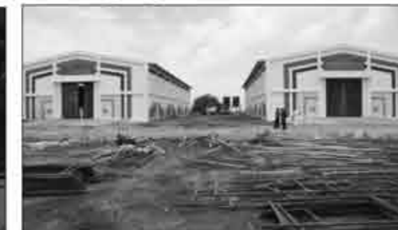
ગોકુળ તૃષા ભંડાર (ગોડાઉન ઘાસવારાનો)