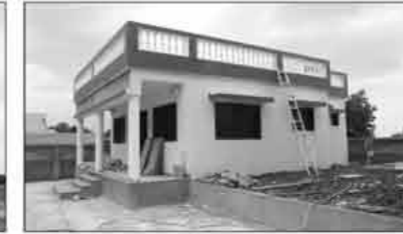
ગોકુળ નિવાસ (સ્ટાફ-ક્વોર્ટર્સ)