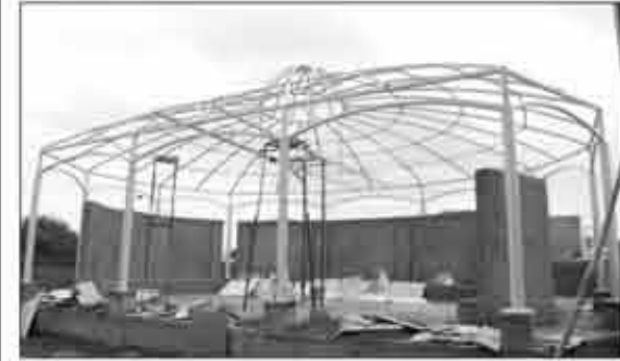
પૂર્ય વાહકોની પરબ (શિલાલેખ-ડોમ)