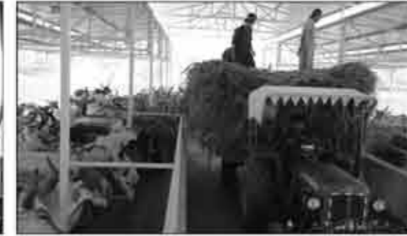
ગોકુળ આશ્રય (પશુવાડા)