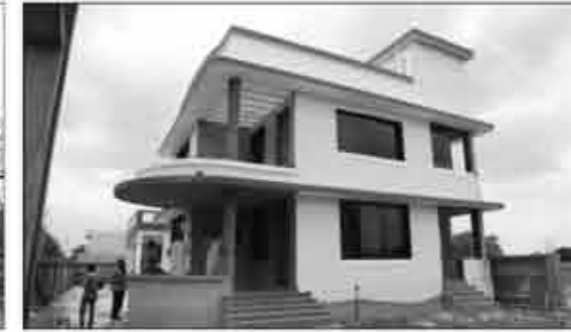
ગોકુળ જીવ મૈત્રી કાર્યાલય (ઓફિસ)