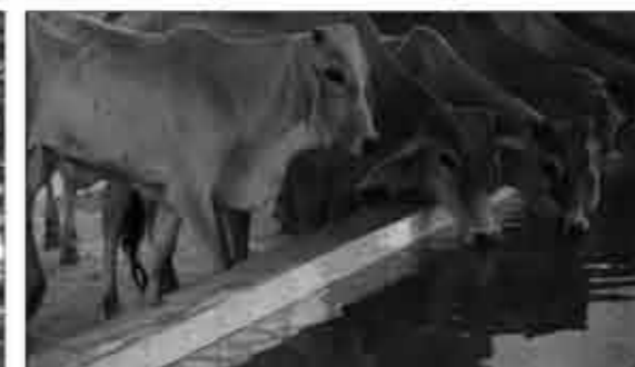
તૃષા તુપ્તિ (અવાડા)