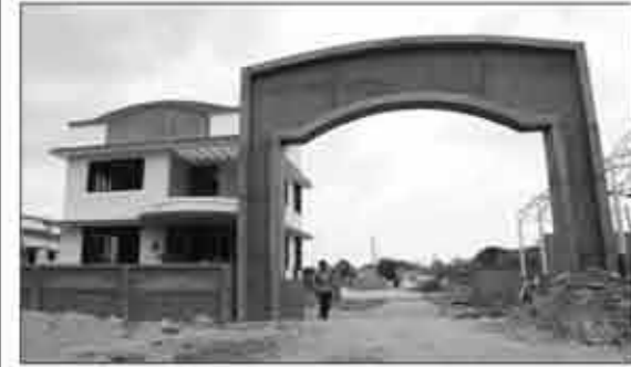
શ્રી ગોકુળ પ્રવેશદ્વાર