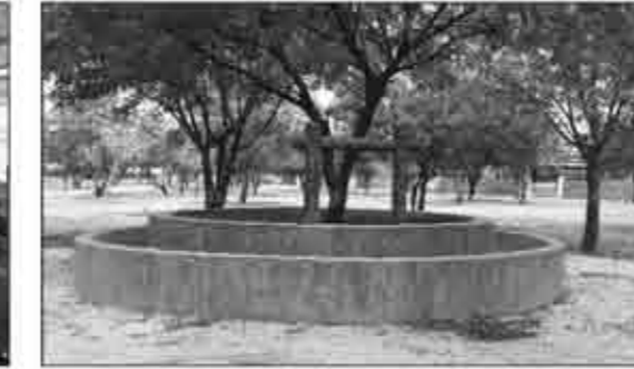
શુદ્ધ તુપ્તિ (ગોળ-ગમાણ)